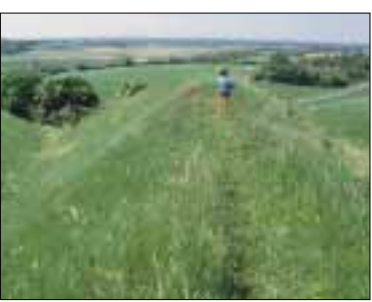
Udsigt fra voldene over Vitsø

Historien er nærværende på Bådent (lokal udtale for borgen) og Søbygård. På det imponerende voldsted har ligget en kongelig fæstning i middelalderen og Søbygård rummer stadig bygningsdele tilbage fra 1580'erne - avlsbygningerne er måske de ældste i landet.