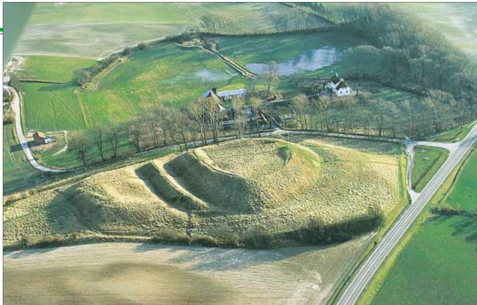
Voldstedet, hvor borgen har ligget og herregården Søbygård ved siden af (Foto fra 1994)

Ved Bromaj ⑦ er der også fundet spor af bopladser fra sten-, bronze- og jernalder.