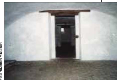
Kælderen i hovedbygningen fra 1500-tallet