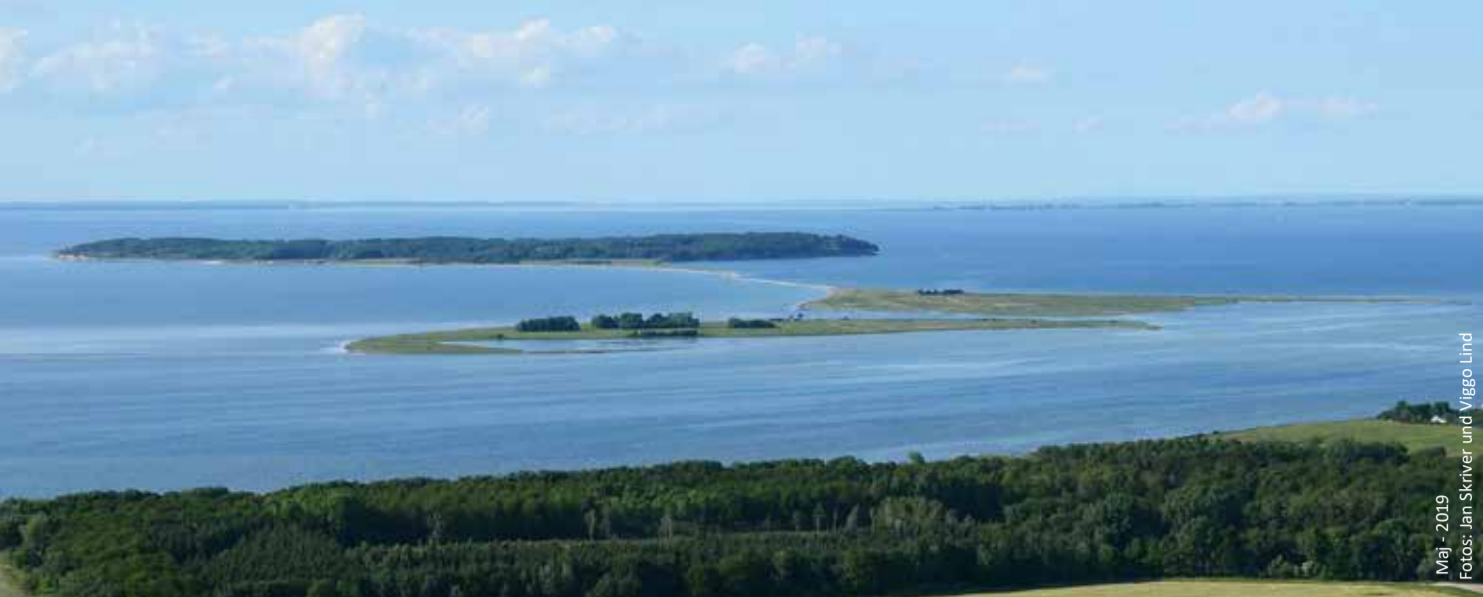
Maj - 2019