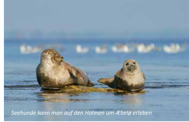
Seehunde kann man auf den Holmen um Æbelø erleben