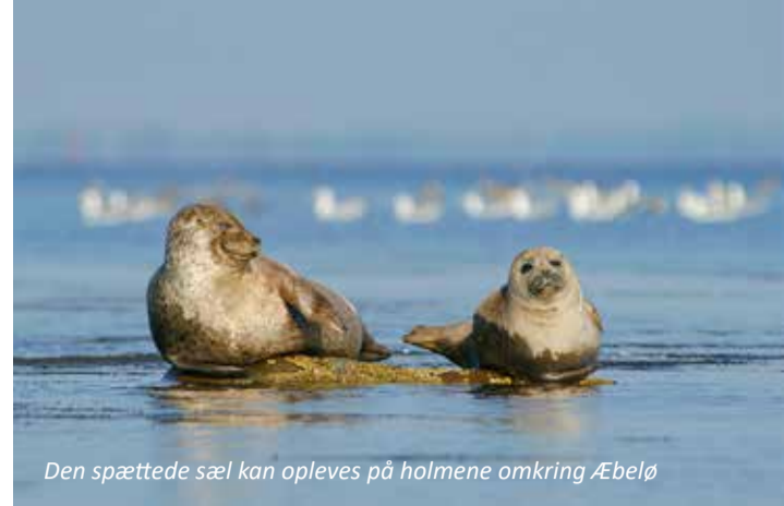
Den spættede sæl kan opleves på holmene omkring Æbelø